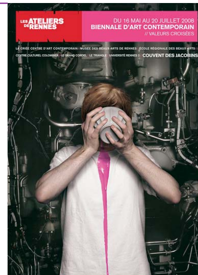
Affiche de la Biennale d'Art Contemporain

Et que par-dessus le marché, il pourra réfléchir sur ce monde particulier de l'entreprise, de ses produits et ce regard singulier porté par l'artiste.