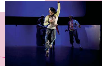
« Roméo et Juliette »

à part entière tout en respectant ses techniques et son identité. Et depuis 17 ans, la qualité est au rendez-vous, autant que l'émerveillement devant cette alliance fortuite entre la maîtrise des chorégraphes issus du monde de la danse contemporaine et le foisonnement des danseurs de hip hop, superbe cocktail d'énergie et de beauté. Ce qui frappe au fil des éditions, c'est cette étonnante capacité du festival à se renouveler, à ne pas se reposer sur ses lauriers. Chaque année, entre 5 et 6 créations sortent, en exclusivité, à l'occasion du festival. Et pour aller encore plus loin, le théâtre de Suresnes a ouvert en décembre 2007 un pôle de production, de diffusion et de transmission de la danse hip hop : Cité Danse Connexions. Unique en France, ce pôle accueille tout au long de l'année des danseurs, leur offrant l'accompagnement, la formation, des espaces de répétition et de remise en forme afin de leur permettre de travailler à leurs créations, dans les meilleures conditions.